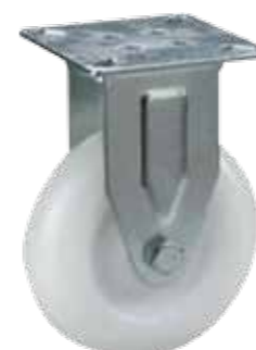
08020200 Roulette avec platine fixe