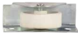
08011600 Roulette pour tiroirs sous lit