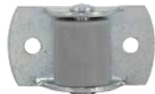
08011700 Roulette pour tiroirs sous lit