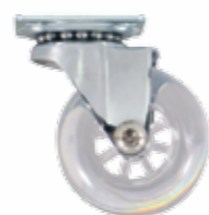
08011900 Roulette à galet translucide et couronne à billes avec platine