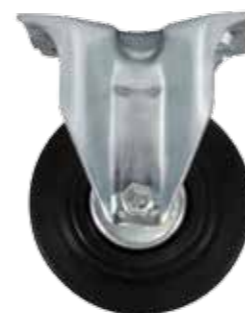
08020100 Roulette avec platine fixe