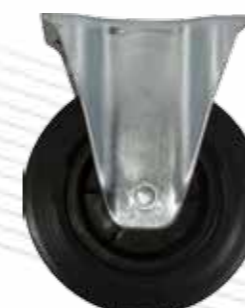
08020400 Roulette avec platine fixe