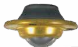
08011800 Roulette avec bille d'acier et platine ronde