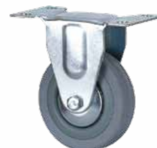
08020300 Roulette avec platine fixe